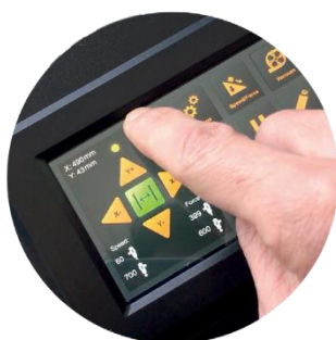
PANNELLO DI CONTROLLO LCD TOUCHSCREEN A COLORI