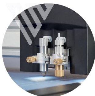
2 SLOT UTENSILI E TELECAMERA AD ALTA RISOLUZIONE CCD