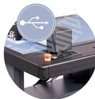
INTERFACCIA USB CHE PERMETTE L'AVVIO ANCHE SENZA PC