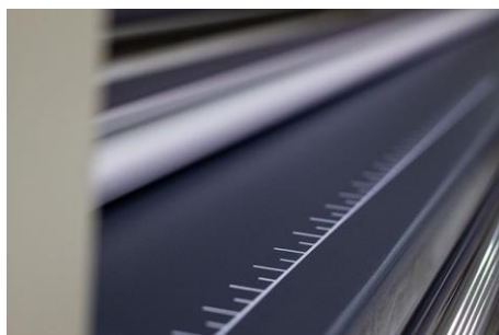
RIPIANO DI APPOGGIO