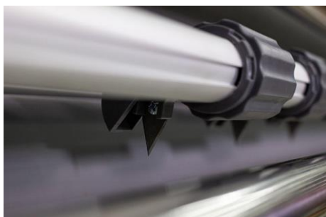
COLTELLI DI RIFILO LATERALE