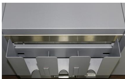
VASSOIO RACCOLTA BIGLIETTI

Durante il taglio, le lame rotative si affilano automaticamente attraverso le mole. Questo per garantire un taglio sempre netto e preciso, anche dopo molte ore di utilizzo.