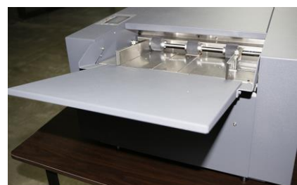
METTIFOGLIO A FRIZIONE

È possibile sostituire la cassetta di taglio in modo da realizzare diversi formati. La sostituzione è molto facile e veloce, è sufficiente allentare e serrare due viti a testa zigrinata.