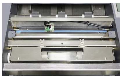
CASSETTA DI TAGLIO

Il pannello di controllo è facile ed intuitivo. L'operatore può selezionare velocemente il layout di taglio e vedere chiaramente il numero di tagli dal display.