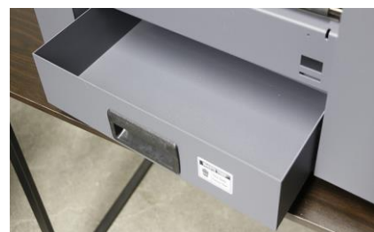
CASSETTO DI RACCOLTA SFRIDI

La taglierina è dotata di un vassoio per la raccolta dei biglietti. È possibile configurarlo per raccogliere e impilare biglietti di svariati formati fino ad un'altezza massima di 90 mm x 5.